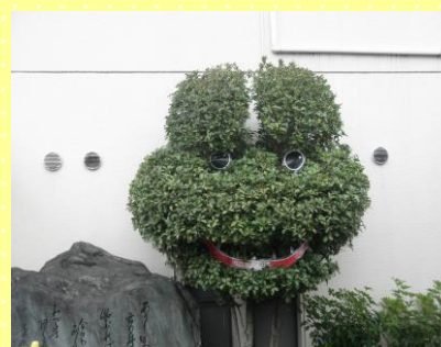
元気になってカエル（病院玄関横）