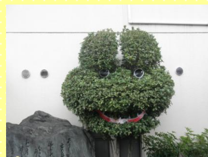
元気になってカエル (病院玄関横)